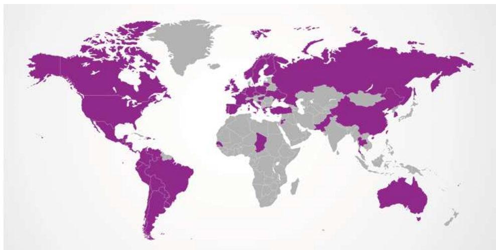
Gráfico 1. #8M 2017. Paro Internacional de Mujeres. Adhesión de países

La conmemoración del 8 de marzo como Día Internacional de las Mujeres cuenta con una vasta trayectoria en el activismo de organizaciones de mujeres y feministas del mundo, y adquirió renovado impulso a fines de los '60 en el contexto de la segunda ola feminista de países del norte; mientras que en países latinoamericanos, en particular del cono sur, las acciones colectivas se retomaron en los años '80, con la recuperación democrática. Desde entonces, de modo paulatino el 8 de marzo se instituyó como fecha clave del activismo de mujeres y feminista a nivel mundial, tanto como espacio de resistencia a la cooptación propiciada por el consumismo capitalista como ocasión para el agasajo de fémimas.